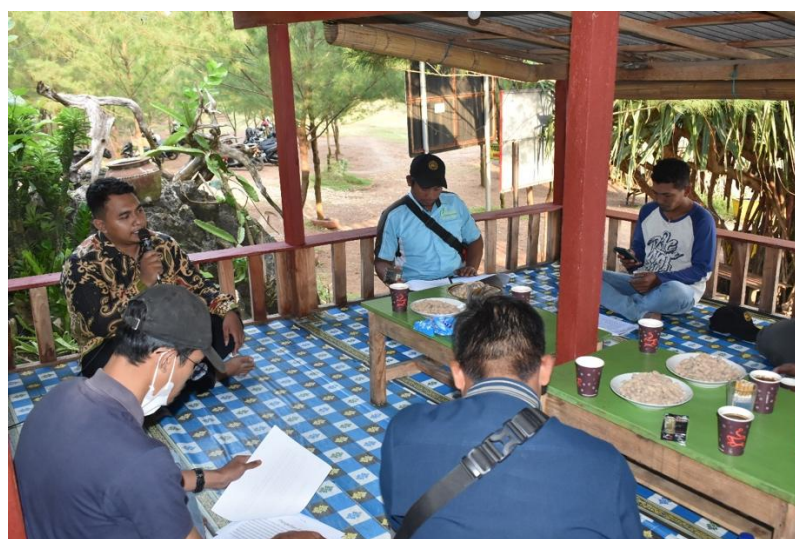
Gambar 4. Pelatihan Budaya Kearifan Lokal.

Selain pelatihan yang berfokus pada pengembangan wisata, juga diberikan pelatihan mengenai kebersihan lingkungan dan kelestarian alam. Masyarakat setempat diajarkan tentang pentingnya menjaga kebersihan pantai dan laut, serta praktik-praktik ramah lingkungan dalam pengelolaan wisata. Ini termasuk pengelolaan sampah, konservasi sumber daya alam, dan perlindungan ekosistem. Diharapkan bahwa dengan memasukkan prinsip-prinsip keberlanjutan ini dalam pengelolaan, Pantai Pacar dapat tetap menjadi destinasi wisata yang indah dan lestari.