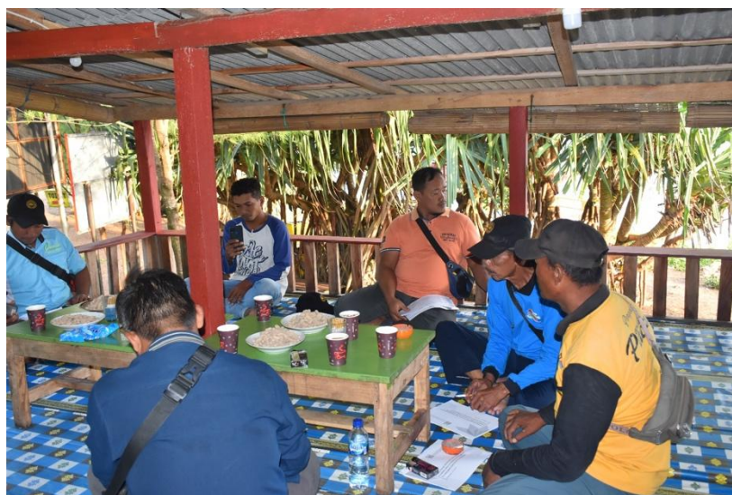
Gambar 4. Dokumentasi Pelatihan pengelolaan Pariwisata.

dalam pengalaman wisata yang ditawarkan. Dengan demikian, wisatawan akan merasa lebih terhubung dengan budaya dan kearifan lokal Pantai Pacar.