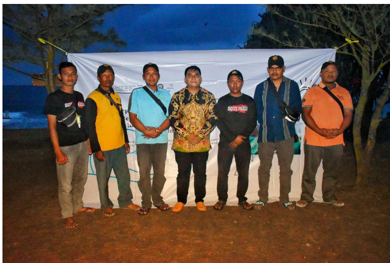
Gambar 5. Penutupan Program Pelatihan.

Secara keseluruhan, program pelatihan ini bertujuan untuk memberdayakan masyarakat setempat dalam mengelola obyek wisata mereka dengan lebih baik. Dengan meningkatkan kualitas pengelolaan, meningkatkan daya tarik, dan menciptakan peluang ekonomi baru, diharapkan bahwa masyarakat setempat dapat merasakan manfaat yang signifikan dalam bentuk peningkatan pendapatan dan kesejahteraan. Selain itu, program ini juga membantu menjaga dan mempromosikan warisan budaya dan alam Pantai Pacar, yang merupakan aset berharga bagi daerah ini.