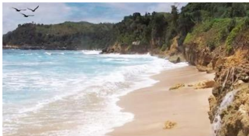
Gambar 2. Pantai Pacar dalam Potret

Pantai Pacar memiliki karakteristik sebagai pantai berpasir yang sangat curam di dasarnya, menjadikannya kurang aman untuk aktivitas berenang karena berbatasan langsung dengan laut bebas. Oleh karena itu, pengembangan berfokus pada aktivitas di pesisir atau darat, seperti atraksi di objek wisata pantainya.