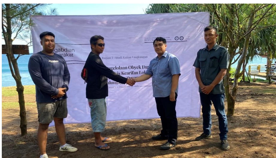
Gambar 3. Dokumentasi Program Pemberdayaan dengan Pelaku Pariwisata

Pertama-tama, dalam upaya mengembangkan Pantai Pacar sebagai destinasi wisata yang lebih menarik, dilaksanakan serangkaian pelatihan yang berfokus pada pengelolaan obyek wisata. Ini mencakup penyusunan rencana strategis pengelolaan yang komprehensif, di mana masyarakat setempat diberikan pengetahuan dan keterampilan tentang bagaimana merencanakan dan mengimplementasikan perbaikan fasilitas, infrastruktur, serta langkah-langkah untuk meningkatkan keamanan dan kenyamanan pengunjung. Upaya ini bertujuan untuk meningkatkan daya tarik Pantai Pacar dan mendatangkan lebih banyak wisatawan.