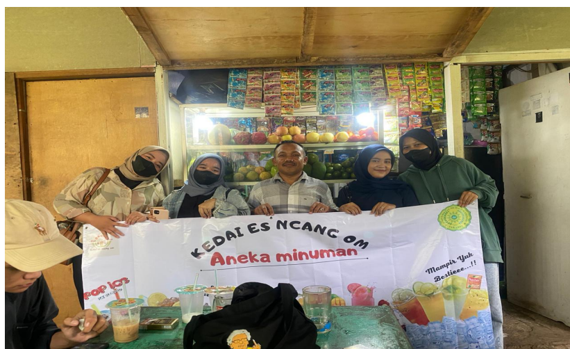
Gambar 2. Mitra & Tim Pendamping

Berdasarkan hasil pendampingan yang telah dilakukan diharapkan toko Es Ncang Om semakin memahami apa itu QRIS, manfaat dan kegunaannya, mengurangi ketergantungan terhadap uang tunai sebagai alat pembayaran utama, meningkatkan keamanan dan efisiensi, menyelesaikan transaksi bisnis, termasuk mengurangi waktu yang diperlukan untuk menghitung uang atau melakukan uang kembalian. Membantu melindungi dari risiko penipuan atau pencurian. Mendapatkan pelaporan keuangan yang lebih akurat dan terstruktur ketika transaksi dicatat secara elektronik. Dapat dengan mudah melacak seluruh transaksi yang dilakukan melalui QRIS sehingga memudahkan pelaporan keuangan dan perencanaan bisnis. Menarik pelanggan lebih luas sehingga dapat meningkatkan penjualannya. Meningkatkan akses UMKM terhadap layanan keuangan tambahan, seperti pinjaman atau investasi. Memberdayakan UMKM dengan pengetahuan dan keterampilan untuk beroperasi dalam ekosistem pembayaran digital yang terus berkembang.