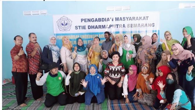
Gambar 2 Hasil dokumentasi setelah pelaksanaan kegiatan

Lebih lanjut, peserta juga menunjukkan peningkatan rasa percaya diri dalam menyuarakan isu lingkungan di forum RT/RW dan komunitas lokal. Perubahan ini menunjukkan bahwa pendekatan edukatif dan partisipatif efektif dalam meningkatkan kesadaran dan kapasitas perempuan sebagai agen perubahan lingkungan. Temuan ini menguatkan hasil sebelumnya yang menekankan pentingnya pelibatan perempuan dalam pengelolaan sampah berbasis rumah tangga untuk mendukung keberlanjutan lingkungan (Amin et al., 2022; Nindya et al., 2022). Praktek lanjutan juga dilakukan sebagai bentuk pengembangan dari pendekatan yang dtelah diterapkan (Amin et al., 2022; Firdiansyah et al., 2023). Dalam praktek tersebut, pemanfaatan limbah gelas plastik secara lebih spesifik diarahkan menjadi produk fungsional seperti tas belanja, yang tidak hanya memiliki nilai estetika, tetapi juga mendukung gaya hidup ramah lingkungan. Hal ini menunjukkan bahwa perluasan ruang lingkup pemanfaatan limbah plastik, baik dari segi bentuk produk, nilai guna, maupun segmentasi pengguna telah dilakukan, sehingga memperkuat bukti bahwa pengelolaan sampah berbasis kerajinan dapat bertransformasi menjadi kegiatan ekonomi kreatif yang berkelanjutan. Dengan demikian, ketika pengelolaan sampah buruk berpotensi menimbulkan risiko kesehatan lingkungan seperti meningkatnya populasi tikus pembawa leptospira (Husni et al., 2023). Adapun dokumentasi kegiatan setelah pelaksanaan kegiatan tertera pada Gambar 2.