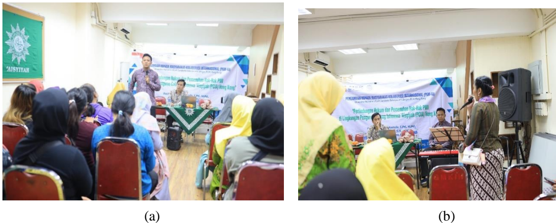
Gambar 2 (a) Pemberian materi penyuluhan hukum dan (b) Sesi diskusi dengan para PMI Hong Kong

Kegiatan PkM ini dilakukan dalam bentuk penyuluhan hukum, yakni pemberian materi yang di dalamnya terdapat penjelasan tentang perlindungan hukum sebagai tujuan negara, perlindungan PMI dalam UU No. 18 tahun 2017 beserta aturan pelaksanaannya yakni PP Nomor 59 Tahun 2021, masalah-masalah umum yang dihadapi oleh PMI, Kebijakan Pemerintah Hong Kong tentang PMI, serta peran KJRI Hong Kong dalam memberikan perlindungan hukum terhadap PMI Hong Kong. Dokumentasi pemberian materi penyuluhan hukum dan sesi diskusi dengan para PMI hong Kong tertera pada Gambar 2.