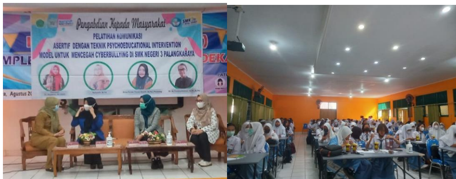
Gambar 2 Kegiatan pelatihan

Pengabdian Kepada Masyarakat Stimulus “Pelatihan Komunikasi Asertif Dengan Teknik Psychoeducational Intervention Untuk Mencegah Cyberbullying ” pada tanggal 15 Agustus 2022 di SMK Negeri 3 Palangka Raya yang terletak di Jl. R. A. Kartini No.25, Langkai, Kec. Pahandut, Kota Palangka Raya, Kalimantan Tengah 74874. Kegiatan pelatihan dapat dilihat pada Gambar 2.